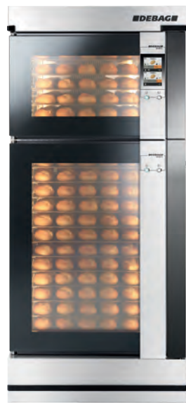
DECON 12/5 mit zwei Backkammern und One-Touch-Display