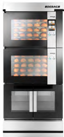
DECON 5/5 mit zwei Backkammern, Gärschrank und One-Touch-Display