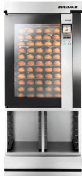
DECON 12 mit einer Backkammer, offenem Zwischengestell und Touch-Display