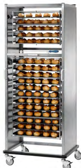
Beschickungswagen für DECON 12/5